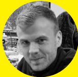
PIT ALFF Energiekonzepte, Energieplanung, Wärmepumpen