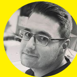
RAPHAEL ZUSSY Domizillierungen, MACO, Ladestationen, IT hardware